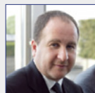
Stéphane FOUKS Havas